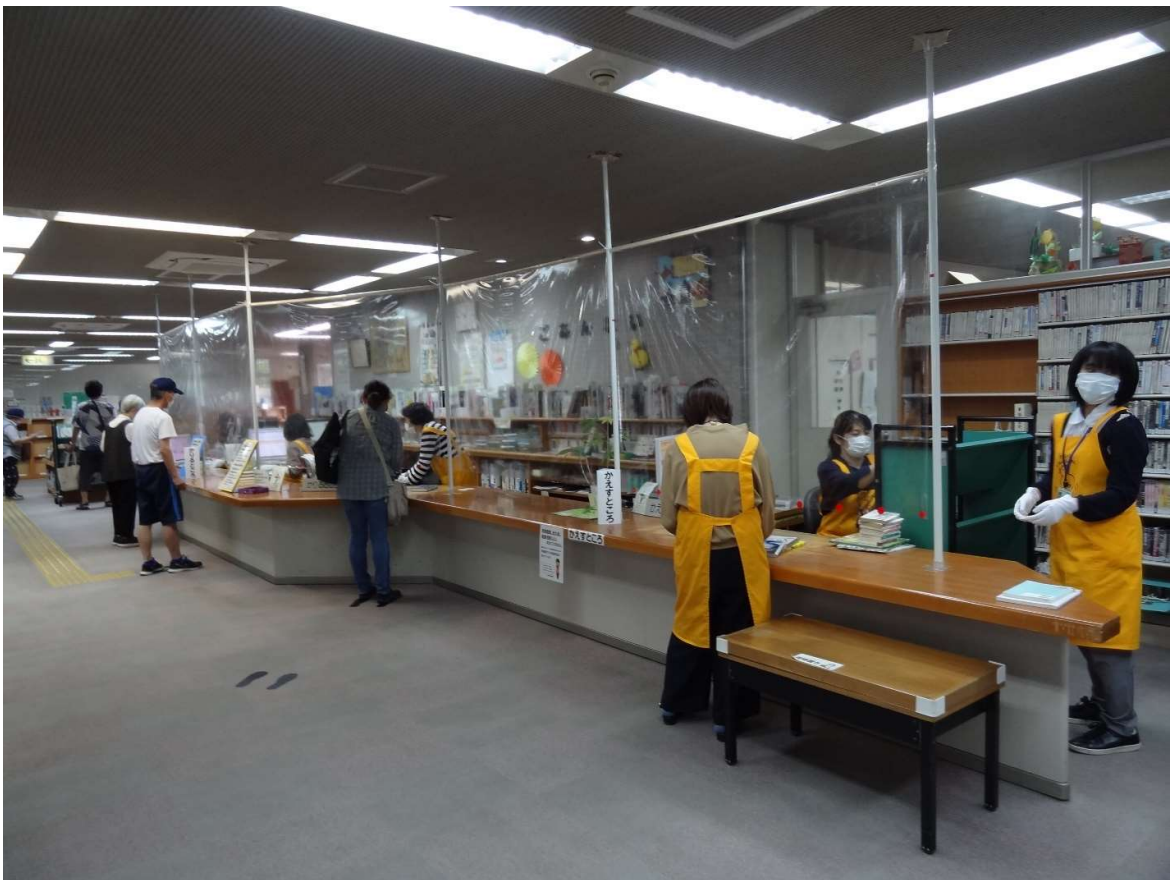
新型コロナウイルス対策のため飛沫シートを施したカウンター