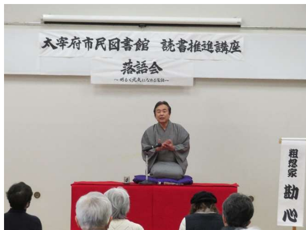
読書推進講座「落語会」