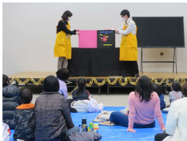
おはなし会のクリスマス