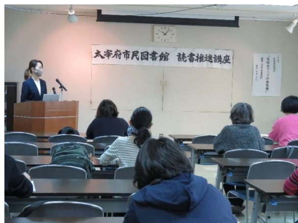
読書推進講座「免疫力アップの食習慣」