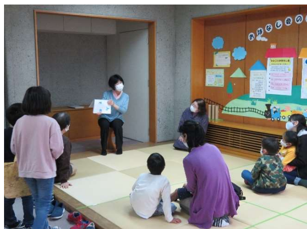
太宰府おはなし会 冬？のおはなし会