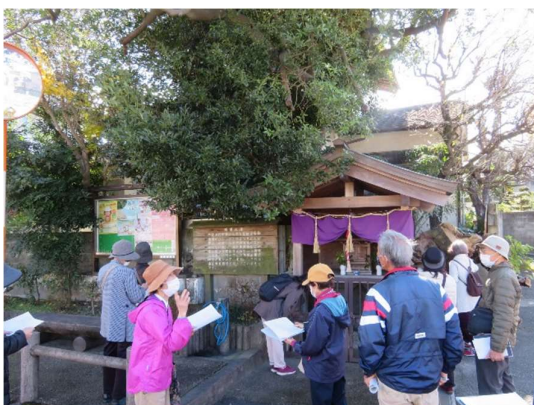
読書推進講座「太宰府歴史講座」