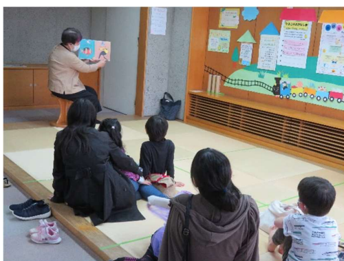
おはなしの広場 太宰府おはなし会 春のおはなし会