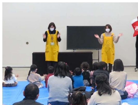
おはなし会のクリスマス