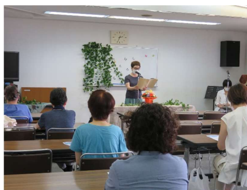
朗読紫苑の会 夏の朗読会