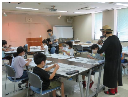
子どもふれあい工作教室