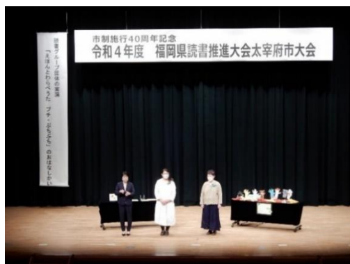
市制40周年記念 令和4年度福岡県 読書推進大会 太宰府市大会