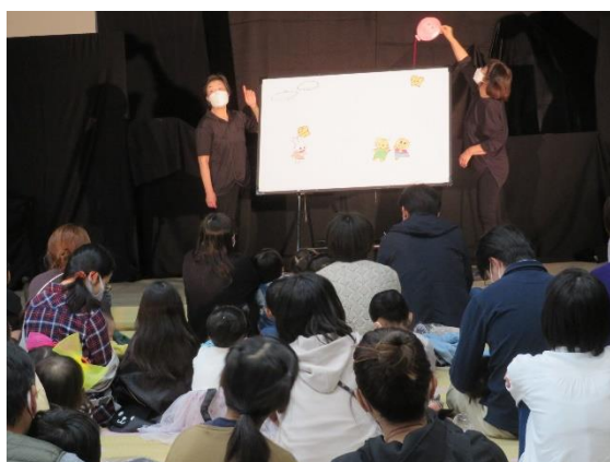
ハロウィンおはなし会