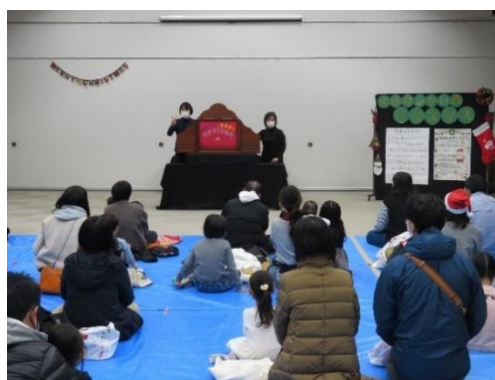
おはなし会のクリスマス